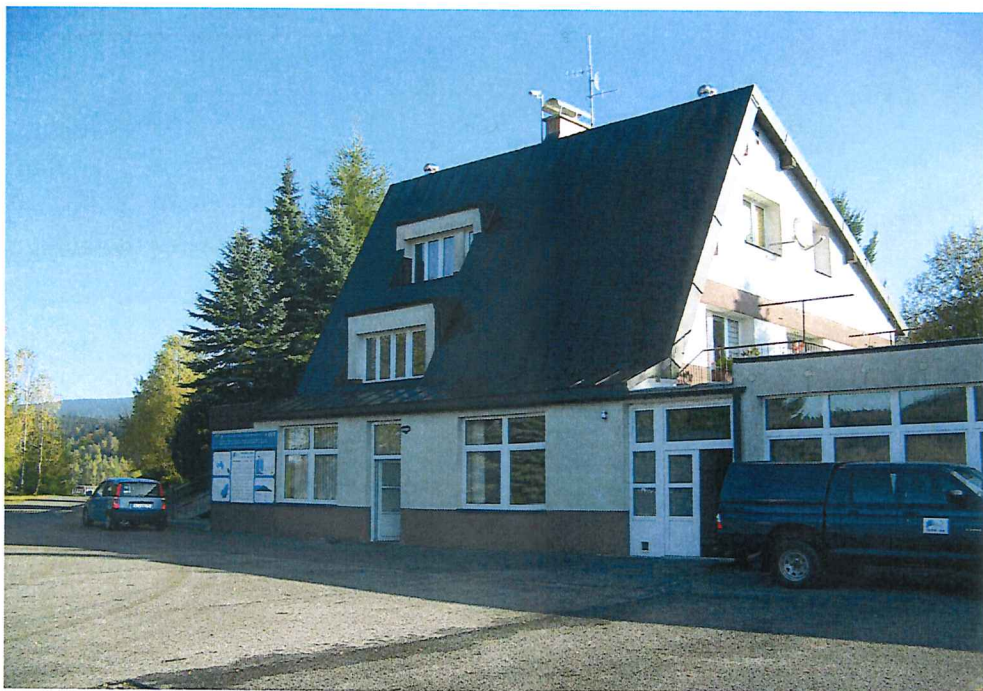
Provozní objekt VD Josefův Důl – obsluha vodního díla.